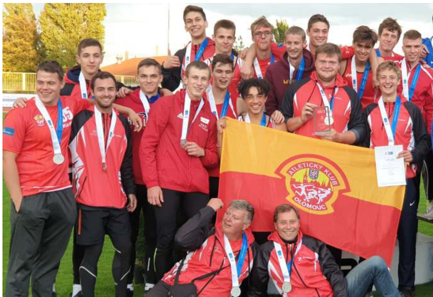
Stříbrné družstvo juniorů