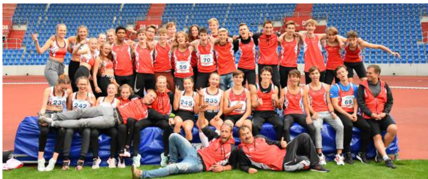
Družstva dorostenců a dorostenek