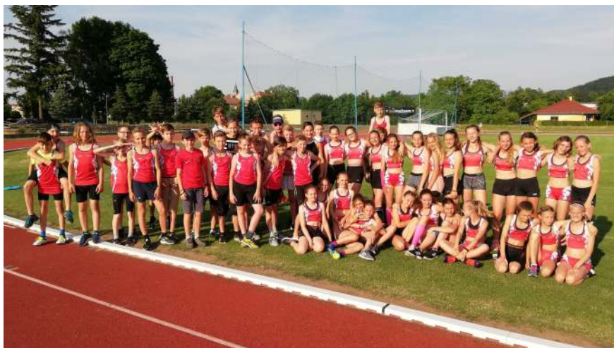
Družstvo mladšího žactva