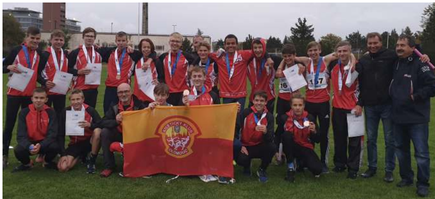
Bronzové družstvo starších žáků