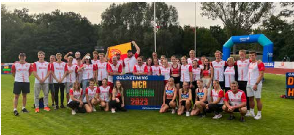
Muži a ženy AK Olomouc na mistrovství ČR družstev v Hodoníně