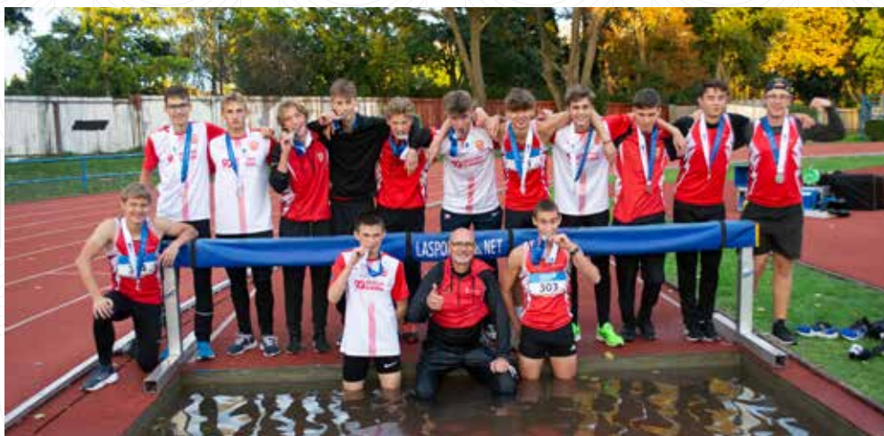
Stříbrné družstvo dorostenců po národním šampionátu na domácím stadionu