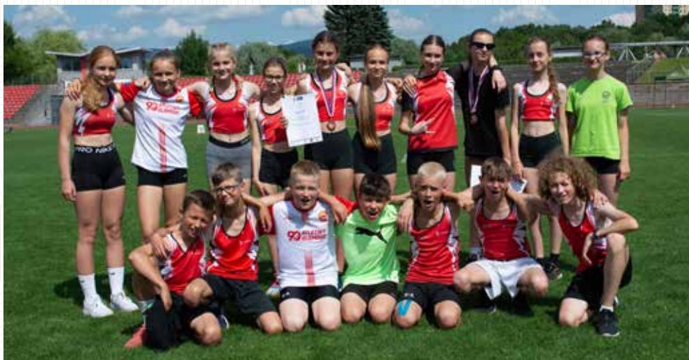
Olomoučtí účastníci mistrovství Moravy a Slezska mladšího žactva