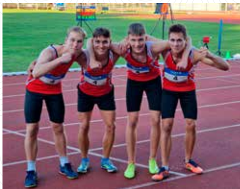
Bronzová štafeta starších žáků na mistrovství ČR