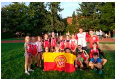
Přípravky AK Olomouc na Krajském přeboru ve víceboji v Prostějově