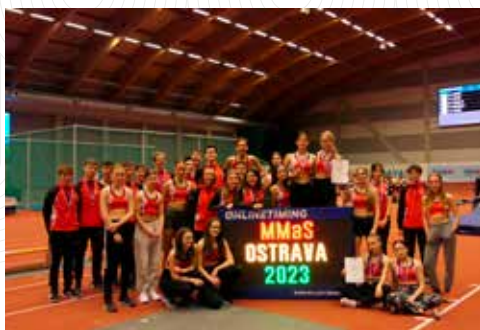
Olomoucké starší žactvo na halovém mistrovství Moravy a Slezska v Ostravě